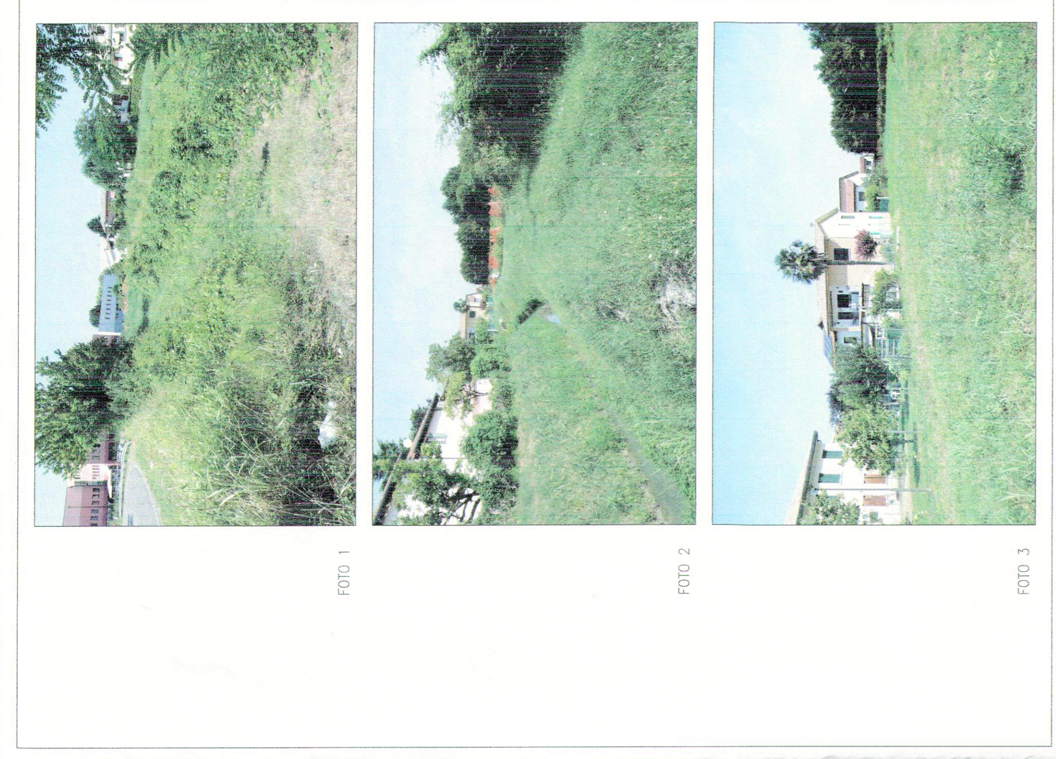
4. RILIEVO FOTOGRAFICO