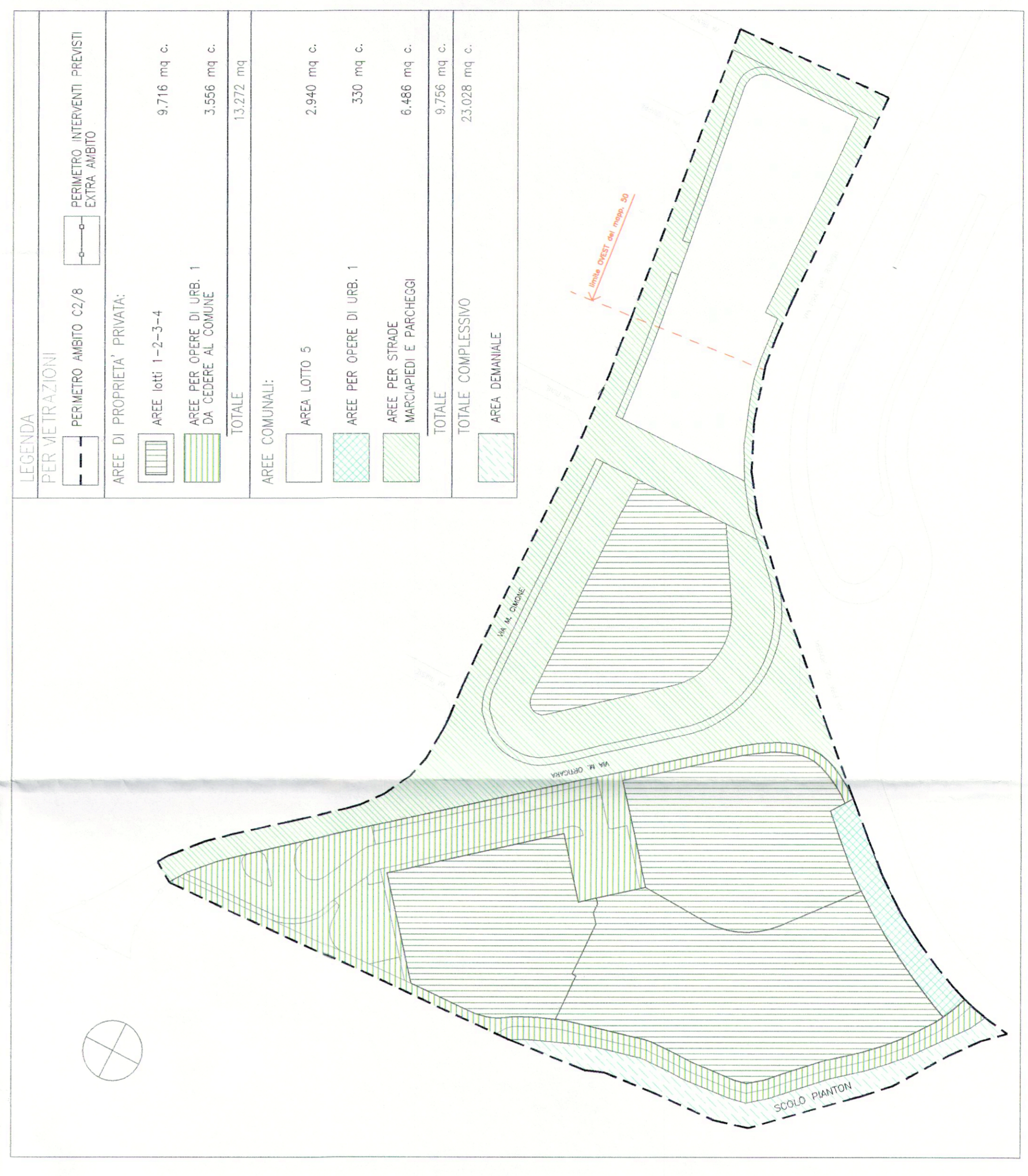
3. ASSETTO DELLE PROPRIETA' E ZONIZZAZIONE DI PROGETTO Scala 1:1000